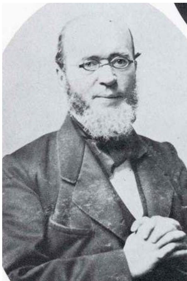
Henry James, Sr., padre de Henry y William

La dulzura de Albany probablemente residía en el hecho de ser nuestra admirada antítesis de Nueva York. Era las vacaciones, mientras que Nueva York era el hogar: al menos, así quedó fijada bien pronto la relación, puesto que debió de ser Albany la primerísima imagen que disfrutaron mis ojos. Nuestros padres habían ido a pasar allí un año o dos, para estar con nuestra abuela a la vuelta del primer viaje de éstos (más bien, el primero de mi madre) a Europa, que tuvo lugar justo después de mi nacimiento y duró, según parece, alrededor de año y medio. A él habré de referirme en otro momento. La de Albany sería, pues, su primera experiencia de llevar una casa, ya que me parece recordar que el invierno que siguió a la boda lo pasaron en la antigua Astor House, que no era antigua entonces, y sí el gran hotel moderno y elegante de Nueva York, el único con tales pretensiones, y el que de alguna manera iba a proyectar su imagen imponente, la de un enorme cubo de granito con vastos interiores cálidos y oscuros, sobre algunas de las posteriores y más sensibles etapas de mi infancia. Evidentemente (u oscuramente, debería decir quizá), mis padres volvieron a recurrir a ese alojamiento en diversas ocasiones, como ya lo habían hecho con anterioridad, y con tan